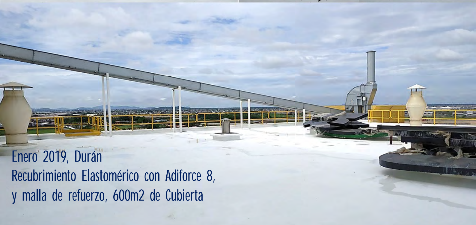
Enero 2019, Durán Recubrimiento Elastomérico con Adiforce 8, y malla de refuerzo, 600m2 de Cubierta