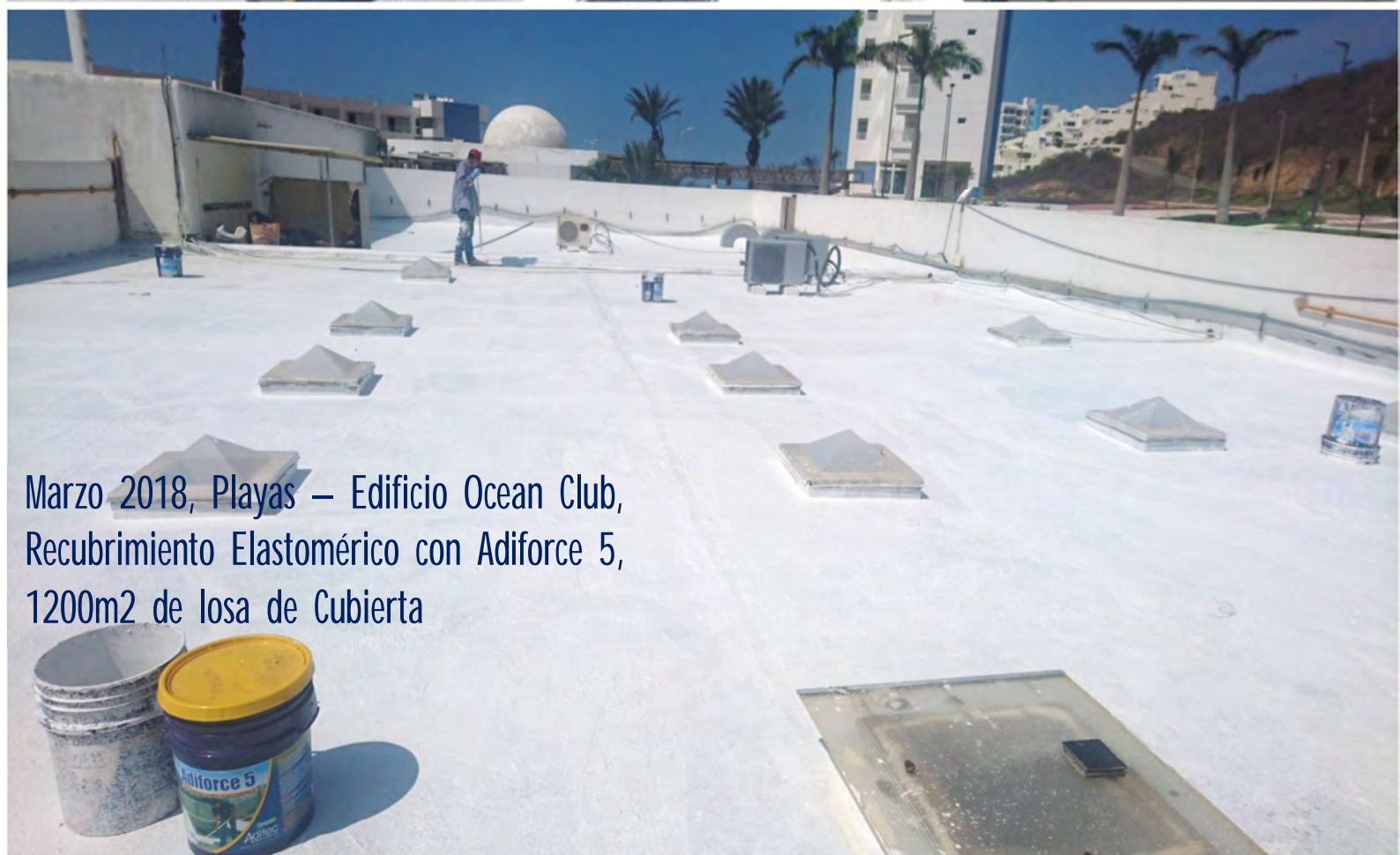
Marzo 2018, Playas – Edificio Ocean Club, Recubrimiento Elastomérico con Adiforce 5, 1200m2 de losa de Cubierta