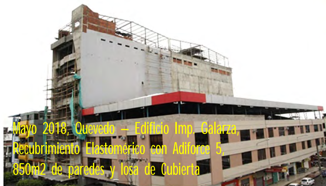
Mayo 2018, Quevedo – Edificio Imp. Galarza, Recubrimiento Elastomérico con Adiforce 5, 850m 2 de paredes y losa de Cubierta